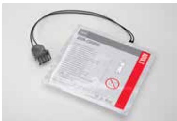
EDGE System-elektrodes met QUIK-COMBO-stekker en REDI-PAK ™ preconnect systeem 11996-000017 (kabel lengte 105 cm)