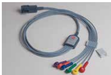
12 lead ECG kabel, 6 precordiale afleidingen