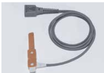
DURA-Y multisite herbruikbare sensor 11996-000106 (> 1 kg)