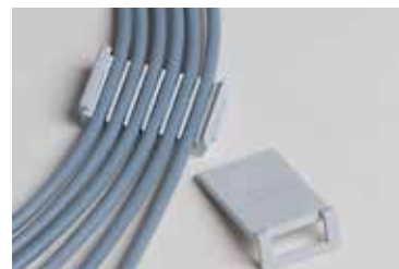
Kabelscheider voor 4 afleidingen