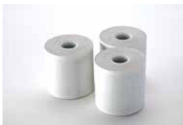
Strip Chart opnamepapier

11240-000016 (100 mm x 22 m, 2 rollen/doos)