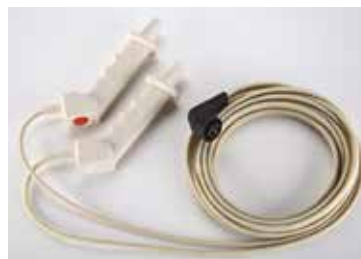
Handgrepen voor interne paddles, met afgiferegeling

13,0 cm 11131-000014 (12,7 cm schacht) 11131-000023 (20,3 cm schacht)