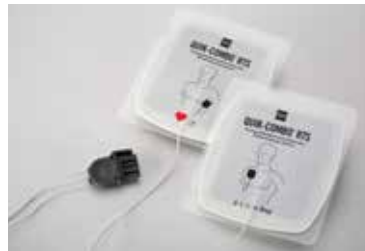
EDGE System RTS (radiotransparante) elektrodes met QUIK-COMBO-stekker 11996-000090 (kabel lengte 60 cm)