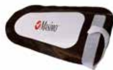
Wegwerpscherming tegen omgevingslicht