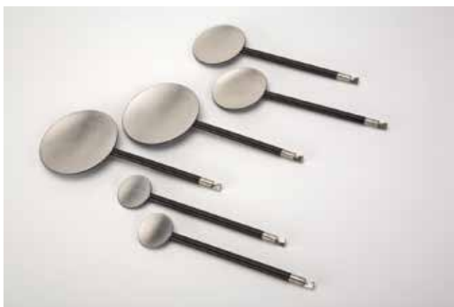
Interne paddles (1 paar) Vereist handgrepen voor interne paddles