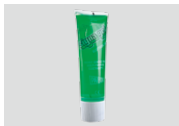
SIGNAGEL®-elektrodegel Voor gebruik met harde paddles. Aanbevolen voor ECG, defibrillatie, biofeedback en EMG 21300-005847 (tube 2,2 dl)