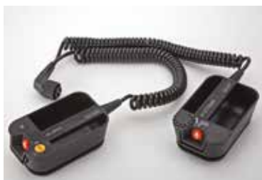
Standaard harde paddles (1 paar) 11998-000048