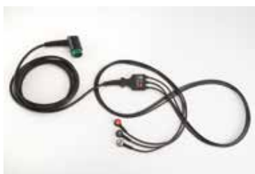
3 Lead ECG kabel