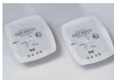
EDGE System-elektrodes met FAST-PATCH-stekker Mag alleen worden gebruikt met QUIK-COMBO aan FAST-PATCH-adapterkabel 11996-000092