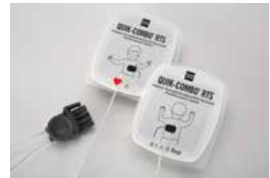
EDGE System RTS-elektrodes voor kinderen met QUIK-COMBO-stekker Uitsluitend te gebruiken met handmatige monitor/defibrillators; na verzending minimaal 12 maanden houdbaar. 11996-000093 (kabel lengte 60 cm)