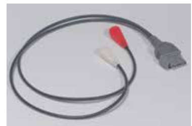
FAST-PATCH ® -adapterkabel Te gebruiken met de QUIK-COMBO-therapie kabel voor de LIFEPAK 12 defibrillator/monitor. 11110-000053