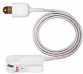
LNOP herbruikbare sensor