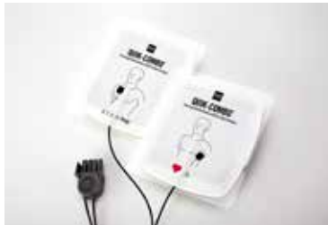
EDGE System-elektrodes met QUIK-COMBO-stekker 11996-000091 (kabel lengte 60 cm)

Minimaal 18 maanden te bewaren na verzending door Physio-Control