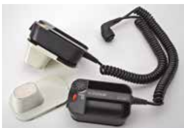
Pediatische paddle (per stuk) Twee vereist 11133-000001