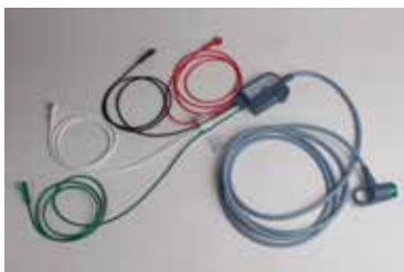
12 lead maintrunk ECG kabel met 4 afleidingen