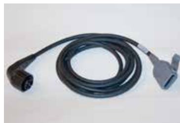
QUIK-COMBO-therapie kabel Te gebruiken met de LIFEPAK 12 defibrillator/monitor. 11110-000040