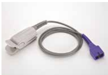
DURASENSOR herbruikbare sensor 11996-000060 (volw)