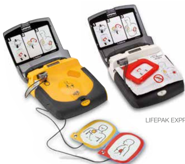
LIFEPAK EXPRESS defibrillator

Garandeer de veiligheid van uw personeel en patiënten. Alleen accessoires en disposables van Physio-Control zijn grondig getest met LIFEPAK-producten. Kies voor de vertrouwde naam en het bedrijf dat hier achter staat. Neem voor bestellingen contact op met uw vertegenwoordiger van Physio-Control.