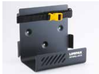
Wandbeugel voor LIFEPAK 1000 of LIFEPAK 500 defibrillators 11210-000001