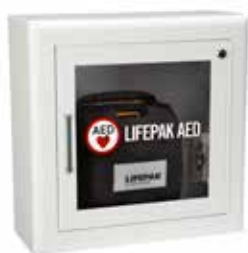
Opbouw (steekt 17,8 cm uit)