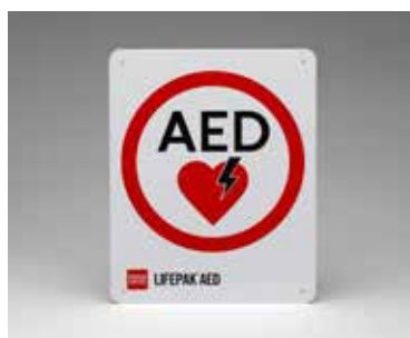
AED vlak bord 11998-000330 (met logo, 20 cm x 25 cm)