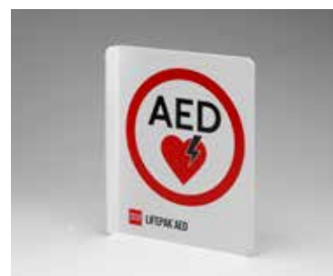
AED haaks bord 11998-000331 (met logo, 20 cm x 25 cm) 11998-000333 (zonder logo, 20 cm x 25 cm)