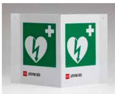
ILCOR panoramisch bord 11998-000329 (met logo, 18 cm x 20 cm)