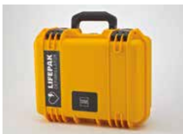
Harde, waterdichte koffer 11260-000015