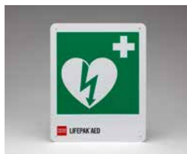
ILCOR vlak bord 11998-000327 (met logo, 20 cm x 25 cm)