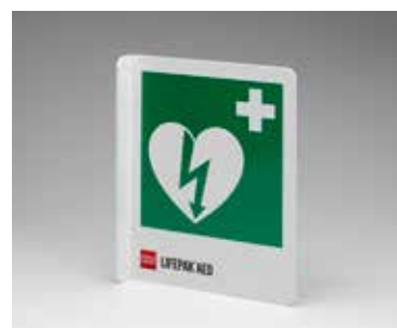
ILCOR haaks bord 11998-000327 (met logo, 20 cm x 25 cm)