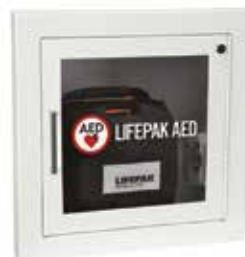
Ingebouwd (steekt 3,8 cm uit)