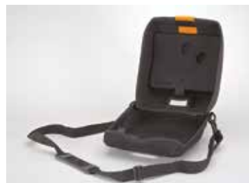
Complete zachte draagtas 21300-004576