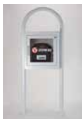
AED kast op vloerstandaard met alarmsignaal

1,3 m, 35,6 cm x 44,2 cm hoog x 17,8 cm diep 11210-000028 (White) 11210-000029 (grijs)