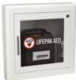
Half-ingebouwd (steekt 7,6 cm uit)

11220-000083 (wit) 11220-000084 (roestvrij staal)